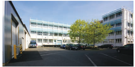
Primera Technology Europe, Mainzer Straße 131, 65187 Wiesbaden, Deutschland

Primeras Ziel ist es, dem Kunden hochwertige und einfach zu bedienende Produkte mit einem hervorragenden Preis-Leistungs-Verhältnis anzubieten. Mittels moderner Produktionstechnologien und einem hohen Maß an Flexibilität werden Lösungen in bestehenden oder neuen Produktbereichen entwickelt.