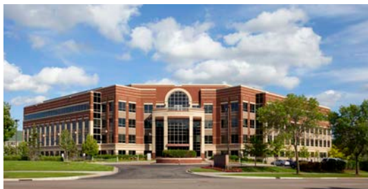
Primera Technology, Inc., Two Carlson Parkway North, Plymouth, Minnesota 55447 U.S.A.

Primeras Ziel ist es, dem Kunden hochwertige und einfach zu bedienende Produkte mit einem hervorragenden Preis-Leistungs-Verhältnis anzubieten. Mittels moderner Produktionstechnologien und einem hohen Maß an Flexibilität werden Lösungen in bestehenden oder neuen Produktbereichen entwickelt.