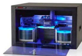
Einbau in Rack/Server-schranke