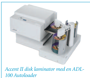
Accent II disk laminator med en ADL-100 Autoloader

Accent II Disc Laminator er endnu et eksempel på, hvorfor Primera er den førende producent af CD/DVD dupliserings- og printudstyr. Primera sælges og supporteres i over 85 lande.