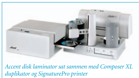
Accent disk laminator sat sammen med Composer XL duplikator og SignaturePro printer

For at laminere enkeltvis, placeres disken på bakken og der trykkes på "Laminate". Det går hurtigt - blot 10 sekunder per disk. For en komplet automatisk brænd/print/laminer-løsning, sættes Accent sammen med enten Primeras ComposerXL, ComposerPro eller ComposerMAX duplikator (med en hylde).