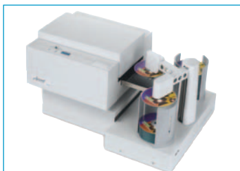
Accent disk laminator med en ADL-100 Autoloader

For det hurtigste resultat, sættes den nye ADL-100 High-Speed Autoloader sammen med Accent. ADL-100 har en kapacitet på op til 100 diske ad gangen. Med den dobbelte robot-arm, kan den laminere 225 diske i timen!